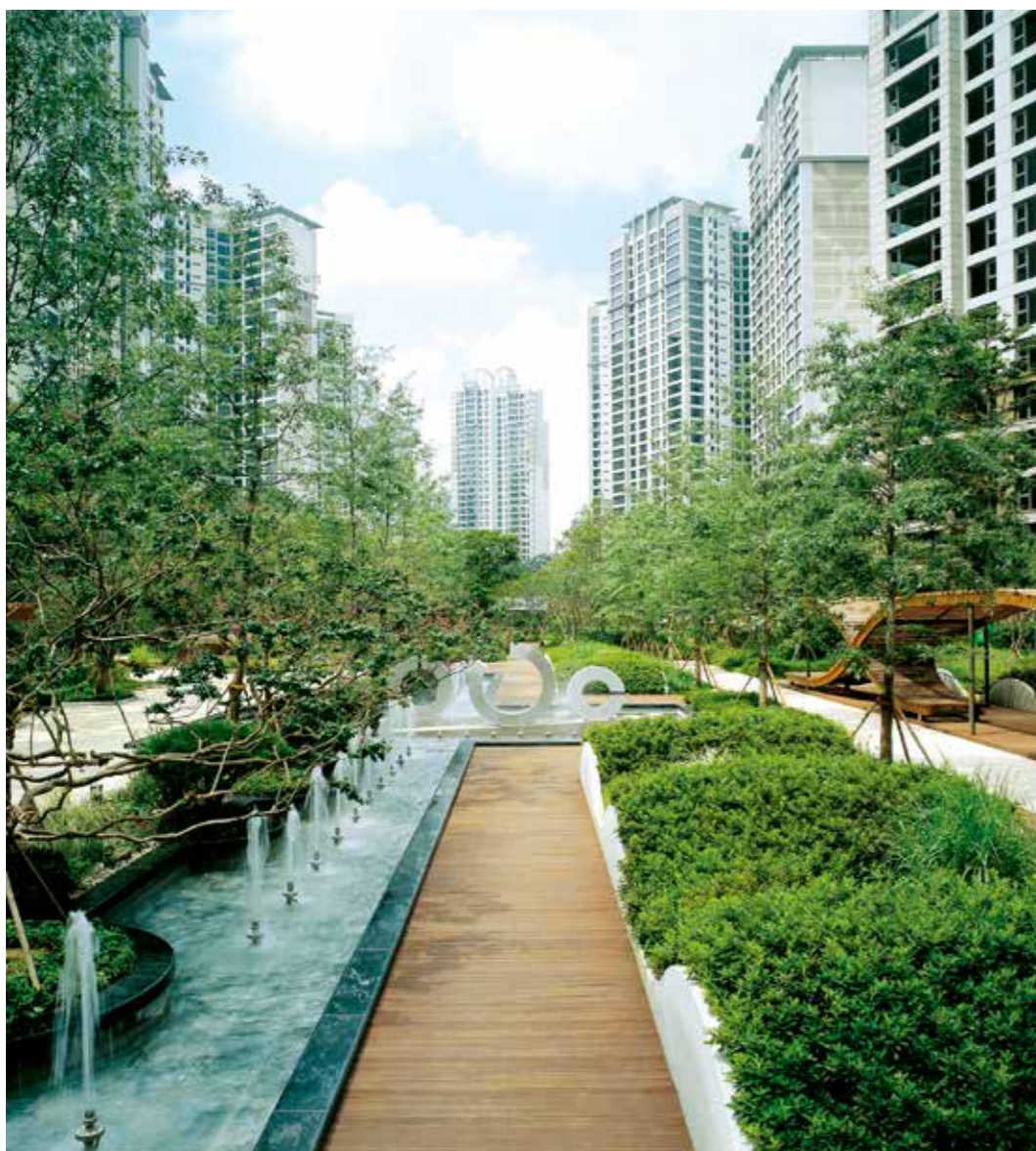
※ 상기 이미지는 GS건설에서 시공한 조경공간의 사례로서 각 단지의 실제 모습과 다를 수 있습니다.